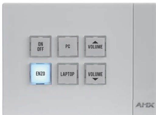
MKP-106L-WH (ランドスケープ、白)